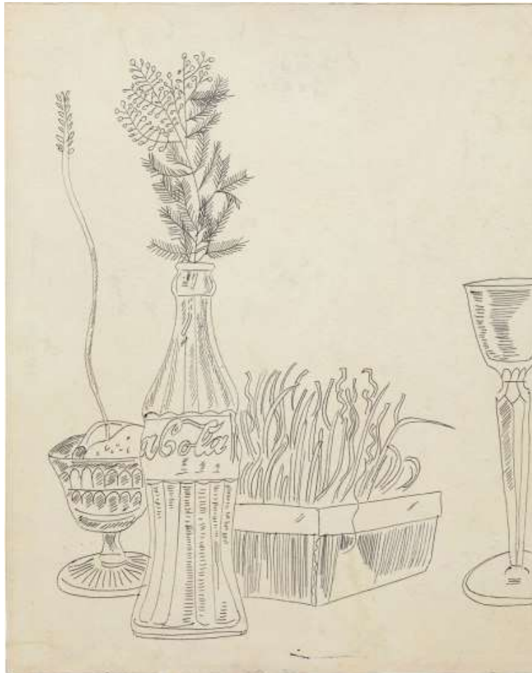
Andy Warhol, Nature morte, 1950 - Encre de Chine, 33 x 41 cm

Ce stage propose une série d'exercices visant à se familiariser avec la nature morte et s'appropriier la beauté des choses ordinaires. On va tenter d'exalter leurs formes par les différents outils de dessin: crayon, fusain, encre de Chine. Mais également par les moyens plastiques : la mise en valeur du trait, le volume par les ombres et les lumières, la question de l'espace, la composition !