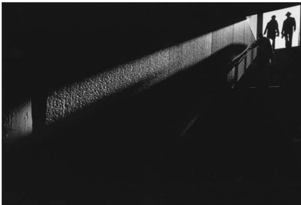
Ray K. Metzker, City Whisper, 1981

Ce stage a pour but de proposer une approche de la photographie argentique noir et blanc de la prise de vue au tirage en laboratoire. Nous explorerons différents formats de prise de vue du 35mm au grand format et réaliserons des tirages de nos prises de vues.