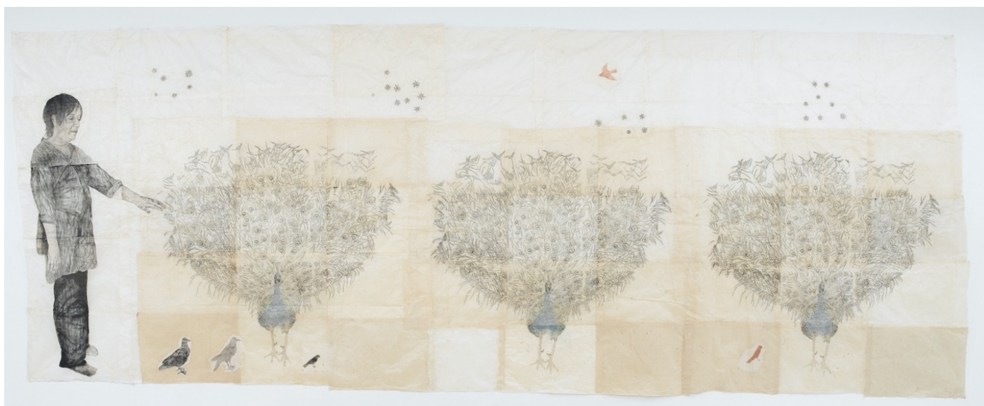
Kiki Smith, Large Birds, 2007 - Encre, crayon et paillettes sur papier népalais, 260 x 630 cm