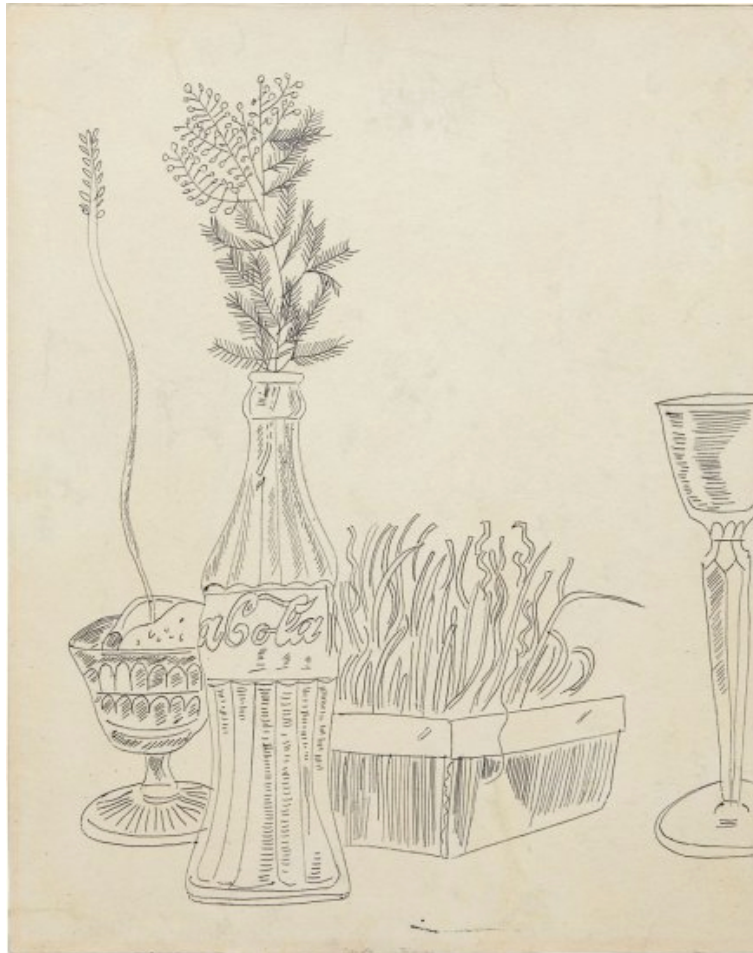
Andy Warhol, Nature morte, 1950 - Encre de Chine, 33 x 41 cm

Ce stage propose une série d'exercices visant à se familiariser avec la nature morte et s'appropriier la beauté des choses ordinaires. On va tenter d'exalter leurs formes par les différents outils de dessin: crayon, fusain, encre de Chine. Mais également par les moyens plastiques : la mise en valeur du trait, le volume par les ombres et les lumières, la question de l'espace, la composition !