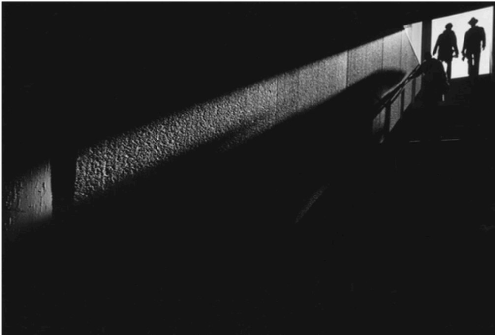
Ray K. Metzker, City Whisper, 1981

Ce stage a pour but de proposer une approche de la photographie argentique noir et blanc de la prise de vue au tirage en laboratoire. Nous explorerons différents formats de prise de vue du 35mm au grand format et réaliserons des tirages de nos prises de vues.