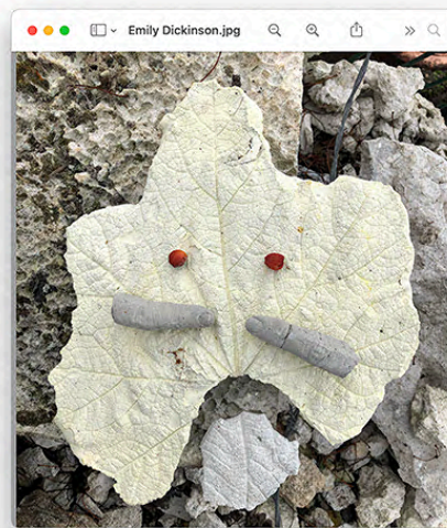
Emily Dickinson, extrait d'une lettre envoyée à son amie Elizabeth Holland, 1884

Cette petite Ruche abritait De telles Promesses de Miel Que le réel devenait Rêve Et les Rêves, Réalité –