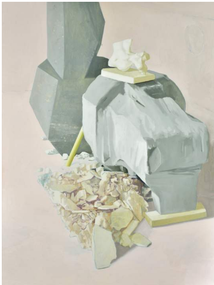
Maude Maris, Holes , huile sur toile, 120 x 90 cm, 2017

de natures mortes. Parfois dotés d'une curieuse aura, ces petits objets de catégories très différentes sont accumulés dans l'atelier de l'artiste : « J'utilise des résidus, ou des choses jetées que je rencontre par