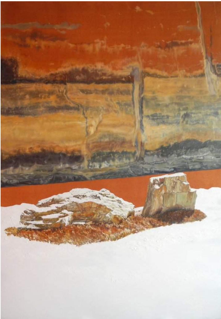
Kristina Shishkova, Le Jardin Zen , huile sur toile, 200 x 140 cm, 2019

joue avec notre perception. De par l'ambiguïté de leur provenance, il s'élabore une certaine étrangeté. Sans être conceptuels, ces paysages combinés sont mentaux. Jamais hasardeux, ils sont reconstitués à partir d'une mémoire d'impressions dérobées lors de promenades et alliées à des images. Par là même, ils demeurent fondamentalement imaginaires. Recomposés sans jamais être artificiels, leur prestance est majestueuse, souveraine. Grave mais pondérée, elle ne pavoise pas. La nature éprouvée et la peinture sont en constant dialogue, comme si l'artiste en peignant tentait de déplier le temps, de fixer le défilement du paysage pour pouvoir perpétuellement l'explorer et le contempler à l'infini.