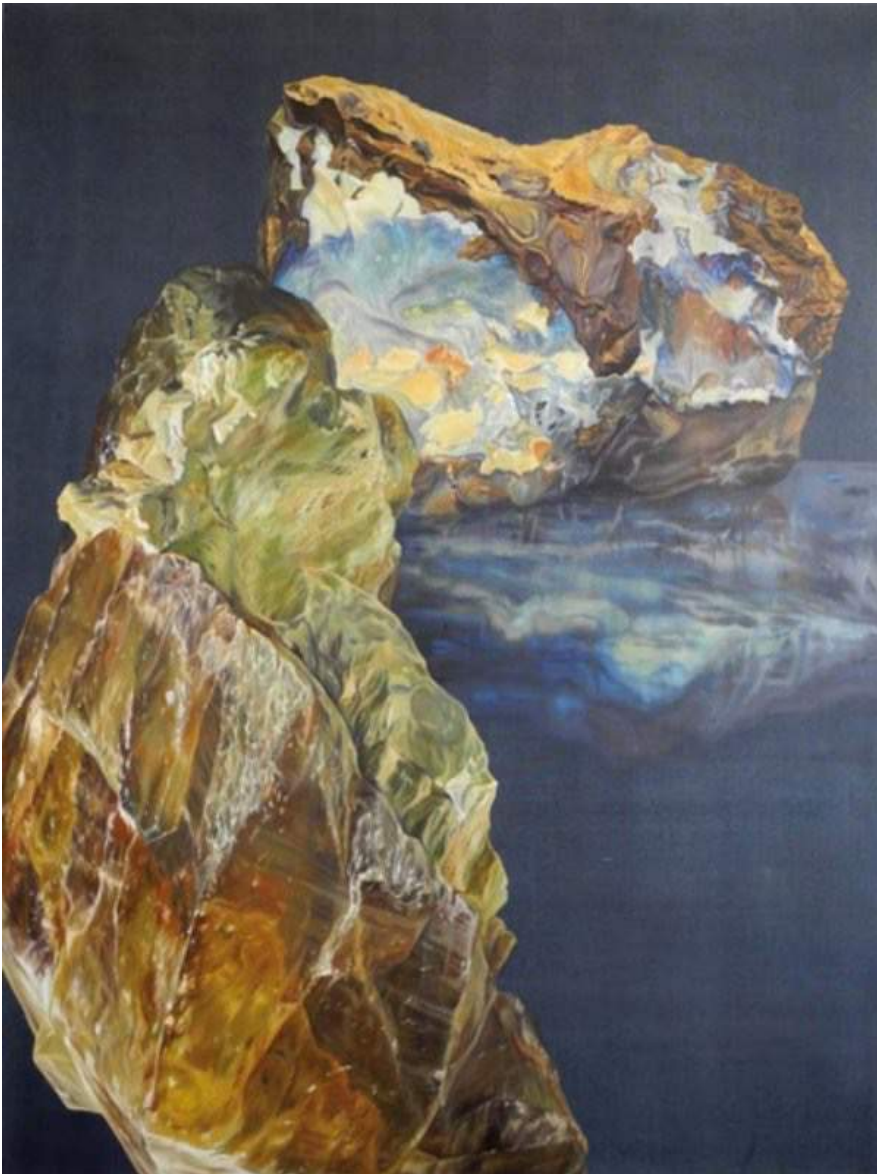
La Rive d'opale , huile sur toile, 160 x 120 cm, 2018

Née le 16 mai 1989 à Plovdiv, Bulgarie Vit et travaille à Paris