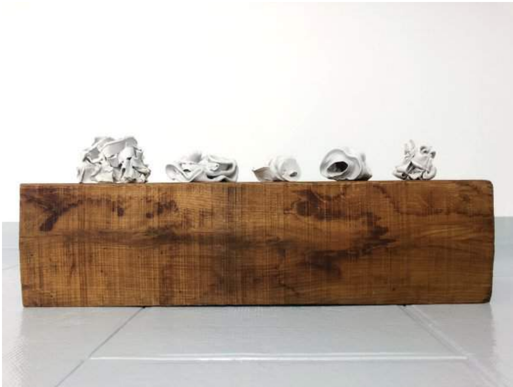
Ce que l'on ôte , 80 x 35 x 35 cm, bois et céramique, 2019