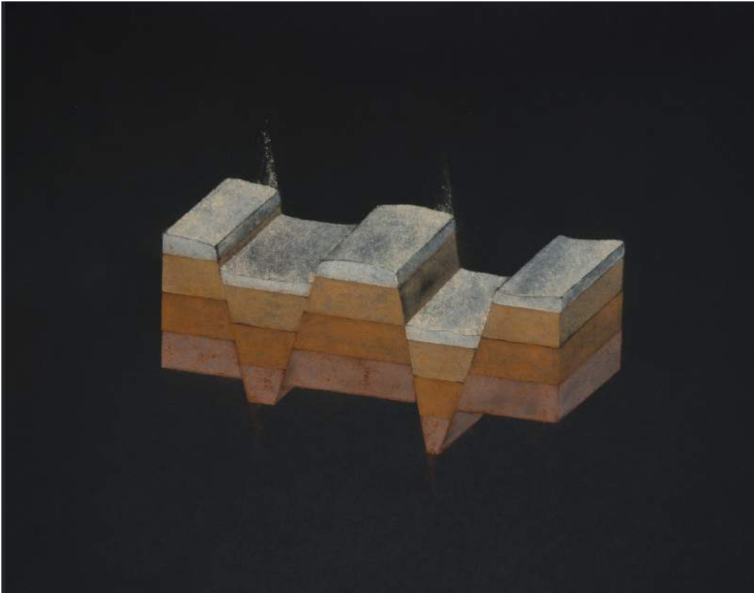
Frictions, série de dessins, prélèvements de terre frictionnés sur papier, 40x50cm, 2018

Né à Reims en 1981 Vit et travaille à Paris