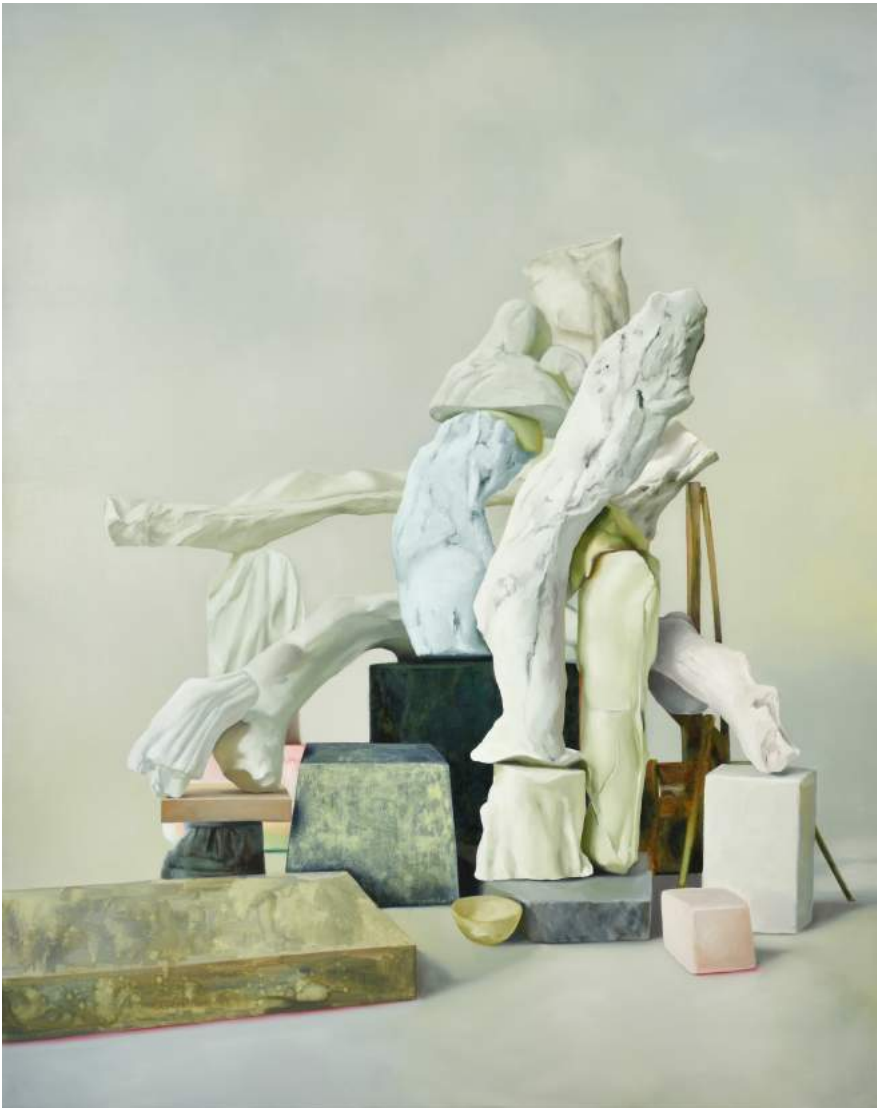
Monument, huile sur toile, 190 x 150 cm, 2017

Née en 1980 en France / Vit et travaille à Paris Représentée par Pi Artworks, Londres/Istanbul