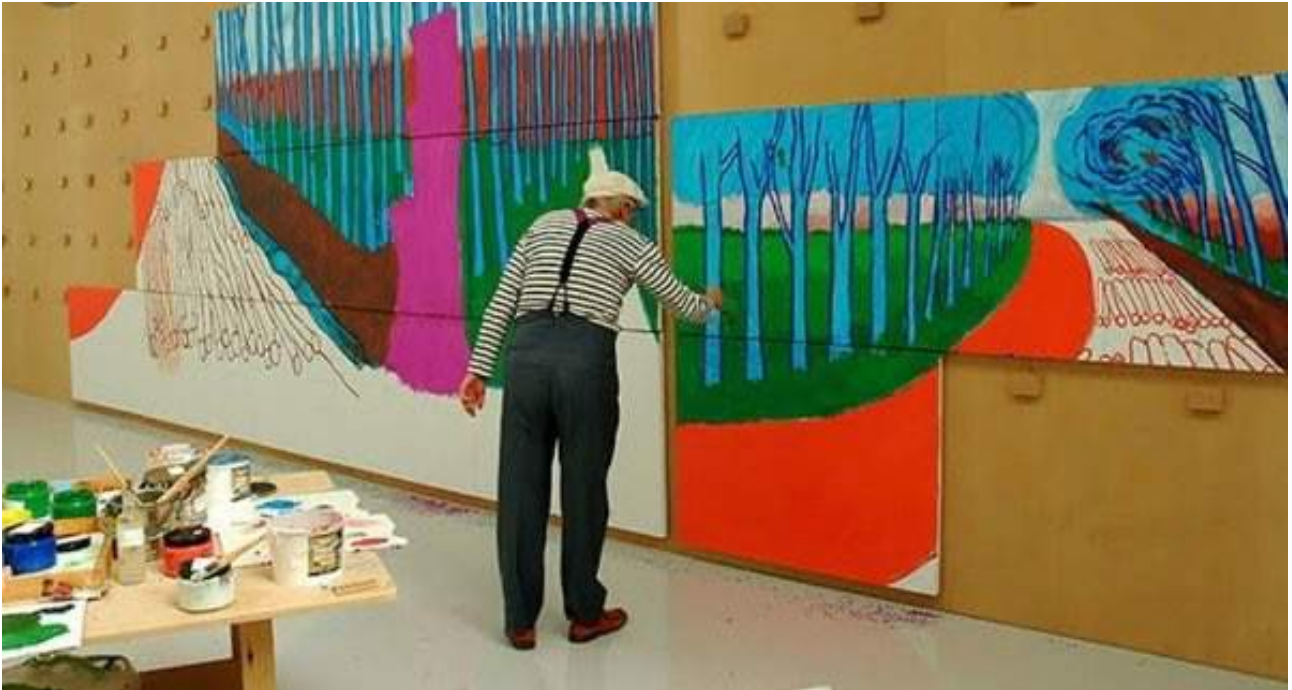
David Hockney dans son atelier en Normandie, 2013